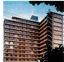
ヴェル八丁堀 1977年(昭和52年) 広島市中区八丁堀 マンション建設販売事業 / 176戸