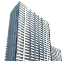
広島ガーデンシティ 白島城北ウエストタワー 2015年(平成27年) 広島市中区東白島町 マンション建設販売事業 / 231戸