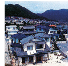
トータテランド安浦 1974年(昭和49年) 広島県豊田郡安浦町大字安登 開発造成販売事業 / 233区画

半世紀以上にわたって、広島をはじめとし、地域に根ざし、「住まいと暮らし」に誠実に向き合うことで、企業成長してきました。