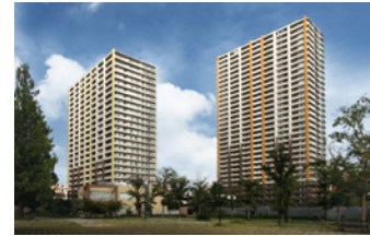
Hiroshima Garden*Garden サウスタワー・ノースタワー 2008~2009年(平成20~21年) 広島市中区東千田町1丁目 マンション建設販売事業 / 450戸