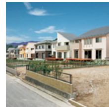
桐陽台「庭園の街」 2006年(平成18年) 広島市安佐北区三入東 開発造成販売事業 / 215区画