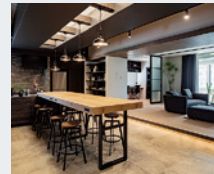
株式会社トータテハウジング 新社屋「toum」完成 2019年(令和元年6月)