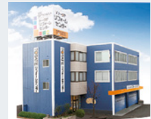
トータテリフォームセンター 庚午ショールームオープン 2004年(平成16年1月)

住まいづくりの領域を総合的に カバーできる体制に。創業50年を 経て、さらなる挑戦がはじまった。