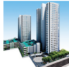
広島ガーデンシティ城北 イーストタワー 2013年(平成25年) 広島市中区東白島町 マンション建設販売事業 / 221戸