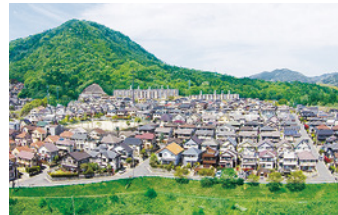
可部希望ヶ丘団地 1996年(平成8年) 広島市安佐北区亀山2丁目 開発造成事業 / 250区画