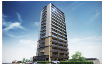
Belles戸坂パークアヴェニュー 2024年(令和6年) 広島市東区戸坂 マンション建設販売事業 / 43戸