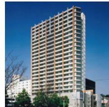
ヴェルタワー下関駅前 2005年(平成17年) 山口県下関市竹崎4丁目 マンション建設販売事業 / 99戸