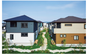
SATONOWA ヴェルコート牛田早稲田 2020年(令和2年)~ 広島市東区牛田早稲田3丁目 開発造成販売事業 / 131区画 第19回 ひろしま街づくりデザイン賞・奨励賞受賞