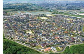
ヴェルシーズン室見が丘 2007年(平成19年) 福岡県福岡市西区 販売事業 / 570区画